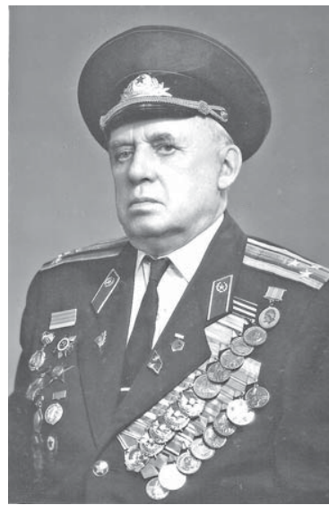
Каменец-Подольский 1980 г.

Герои-пограничники, оборонявшие Сычевку, в большинстве остались лежать в полях на подступах к городу. Проявив массовый героизм, они не дрогнули, не струсили, не стали поднимать вверх руки, а честно исполнили свой воинский долг перед Родиной, перед нами – нынешними потомками тех советских людей, которые пережили годину тяжелого лихолетья.